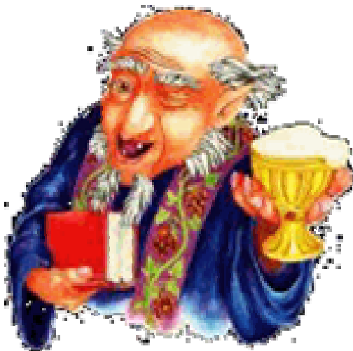
St Arnoldus, patroonheilige der brouwers